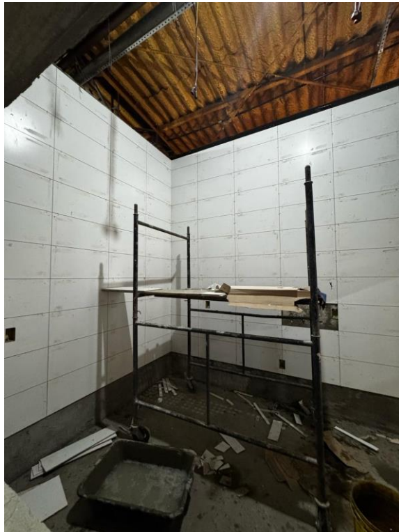
Assentamento de revestimento das paredes