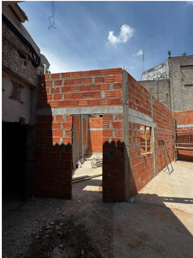
Finalização de elevação da alvenaria