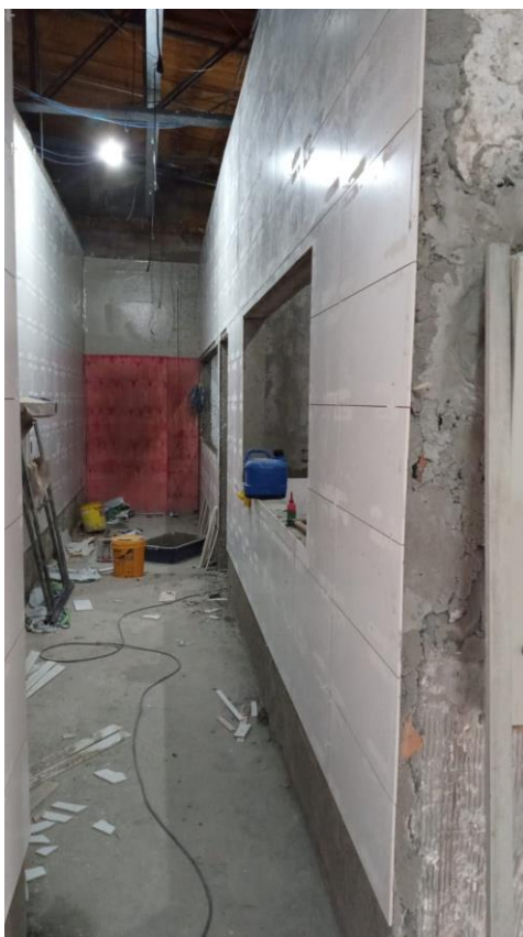
Assentamento de revestimento das paredes