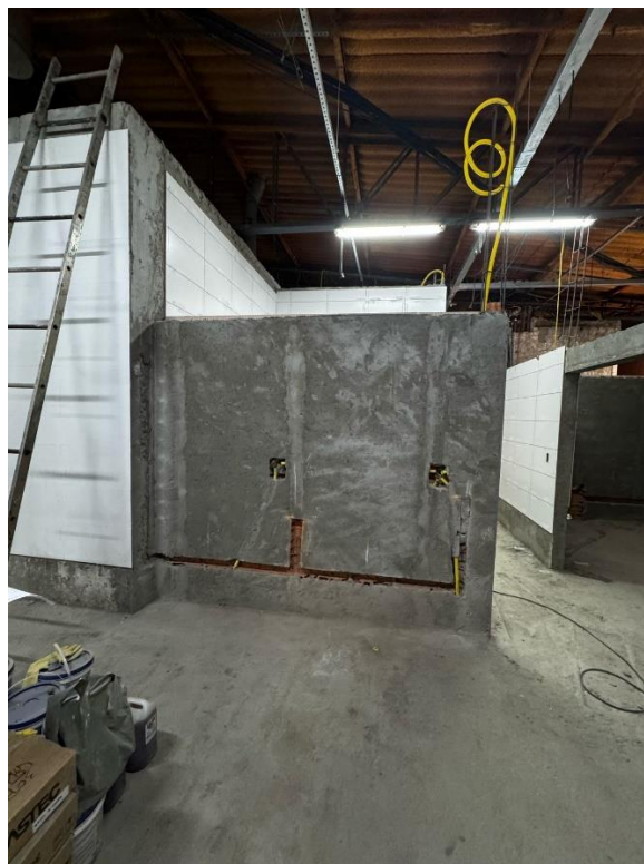
Execução de rasgo para instalações hidráulicas