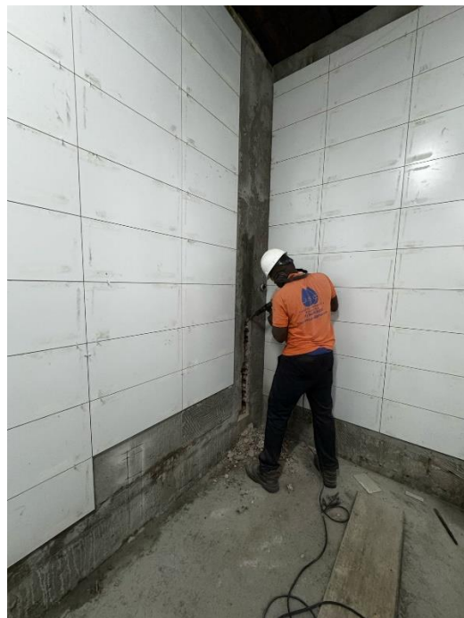
Execução dos rasgos da tubulação hidráulica