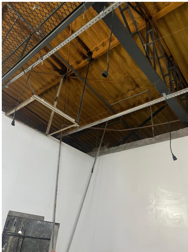
Execução da infraestrutura elétrica da iluminação