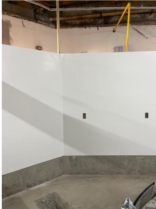
Rejuntamento do revestimento