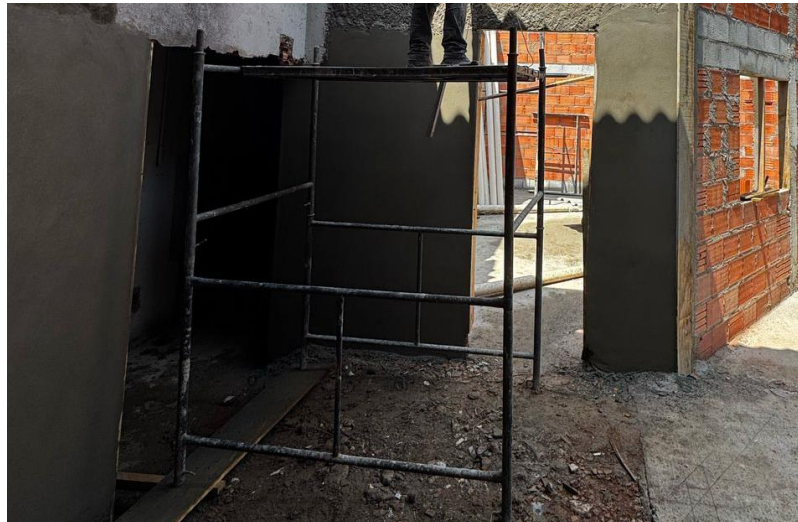
Execução de reboco nas paredes externas