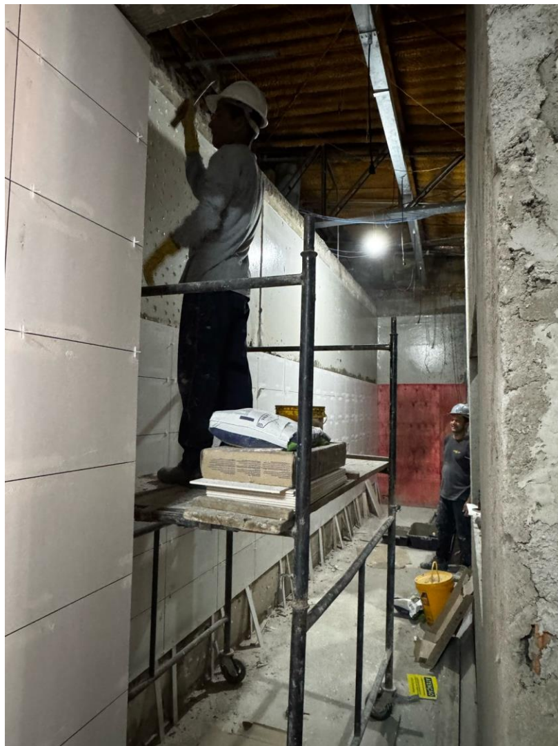
Assentamento de revestimento no corredor de acesso do salão