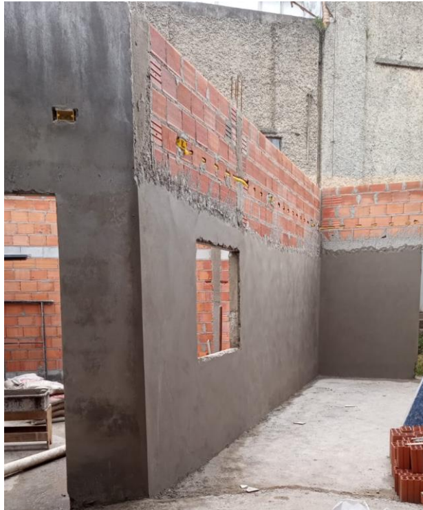
Execução de reboco nas paredes externas